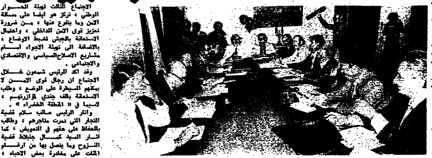
لجنة الحوار الوطني تتساجتماعها امس